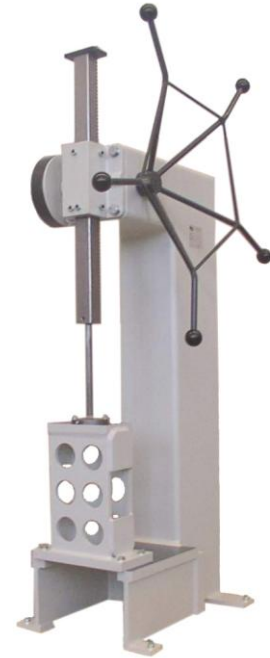
Räumpresse T5 Ausladung 1000mm mit Zwischenstück und Sondertisch