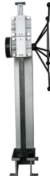
Räumpresse T5 Ausladung 1600mm mit verlängerter Zahnstange