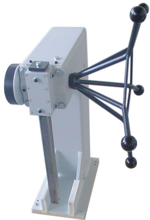
Räumpresse T3 mit speziellem Handrad und Sondertisch