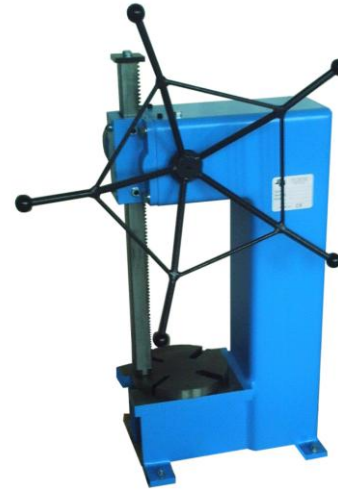
Räumpresse T3 Sonderlackierung